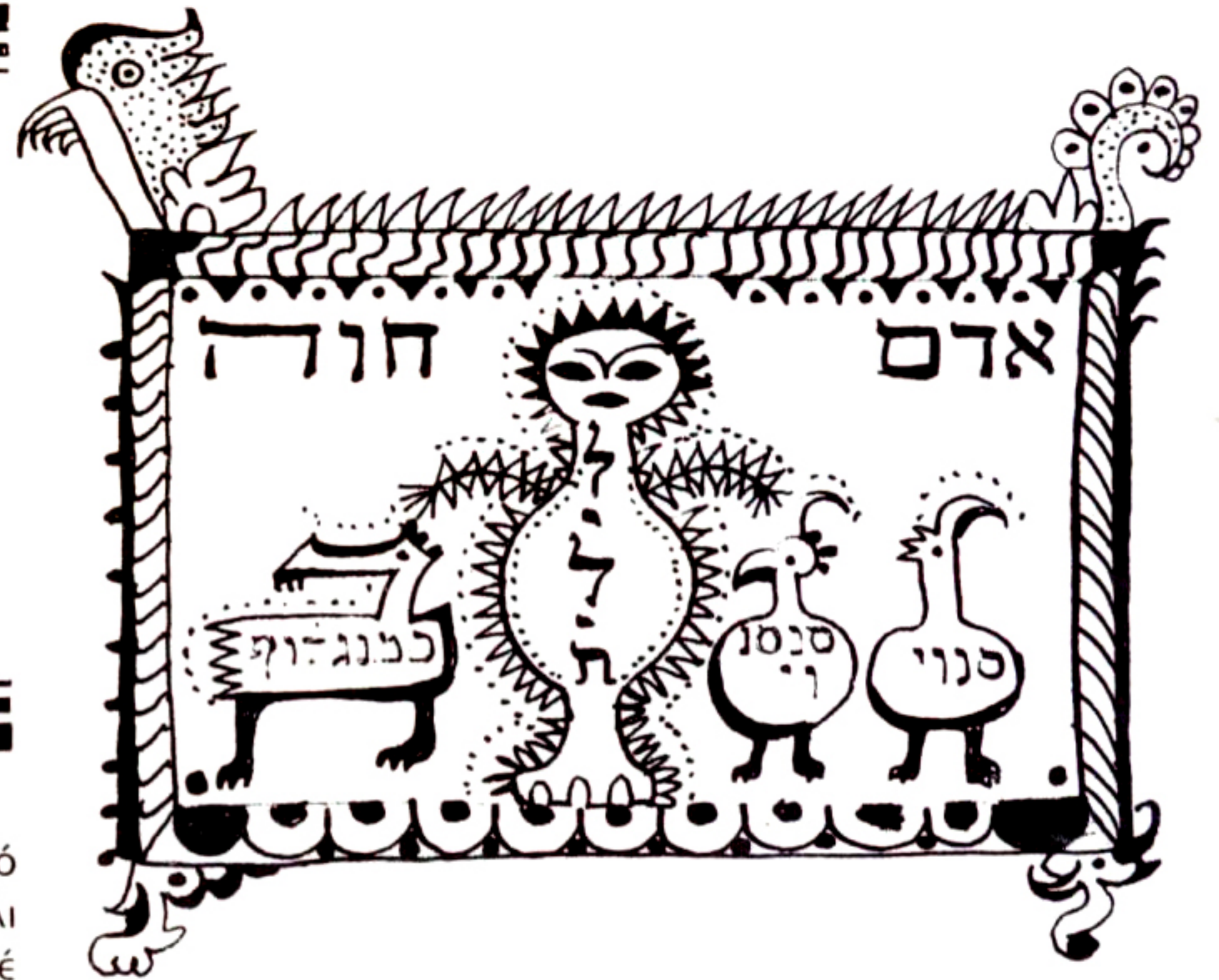
Φυλακτό ή «Kameah», που δείχνει τήν Lillith σε άλυσίδα μέ τούς Sanvai, Sansanvai και Samanglof.

Άν ήταν Χριστιανή, τό δωμάτιό της ήταν διακοσμημένο μέ πολλά εικονίσματα. Άν ήταν Μουσουλμάνη, θά υπήρχε ένα «Qur'an» (Κοράνι) κρεμασμένο πάνω από τό κρεβάτι της και γύρω στό δωμάτιο θά υπήρχαν λωρίδες χαρτιού μέ μαγικά τραγούδια, σχεδιασμένα για να άπομακρύνουν τά κακά πνεύματα. Έάν ήταν Έβραία θά ήταν πιθανόν να δεῖ κανείς παρόμοια κομμάτια χαρτιού αλλά μέ τά όνόματα Lillith, Sansanvai, Sanvai και Samanglof. Τό μαντήλι στό