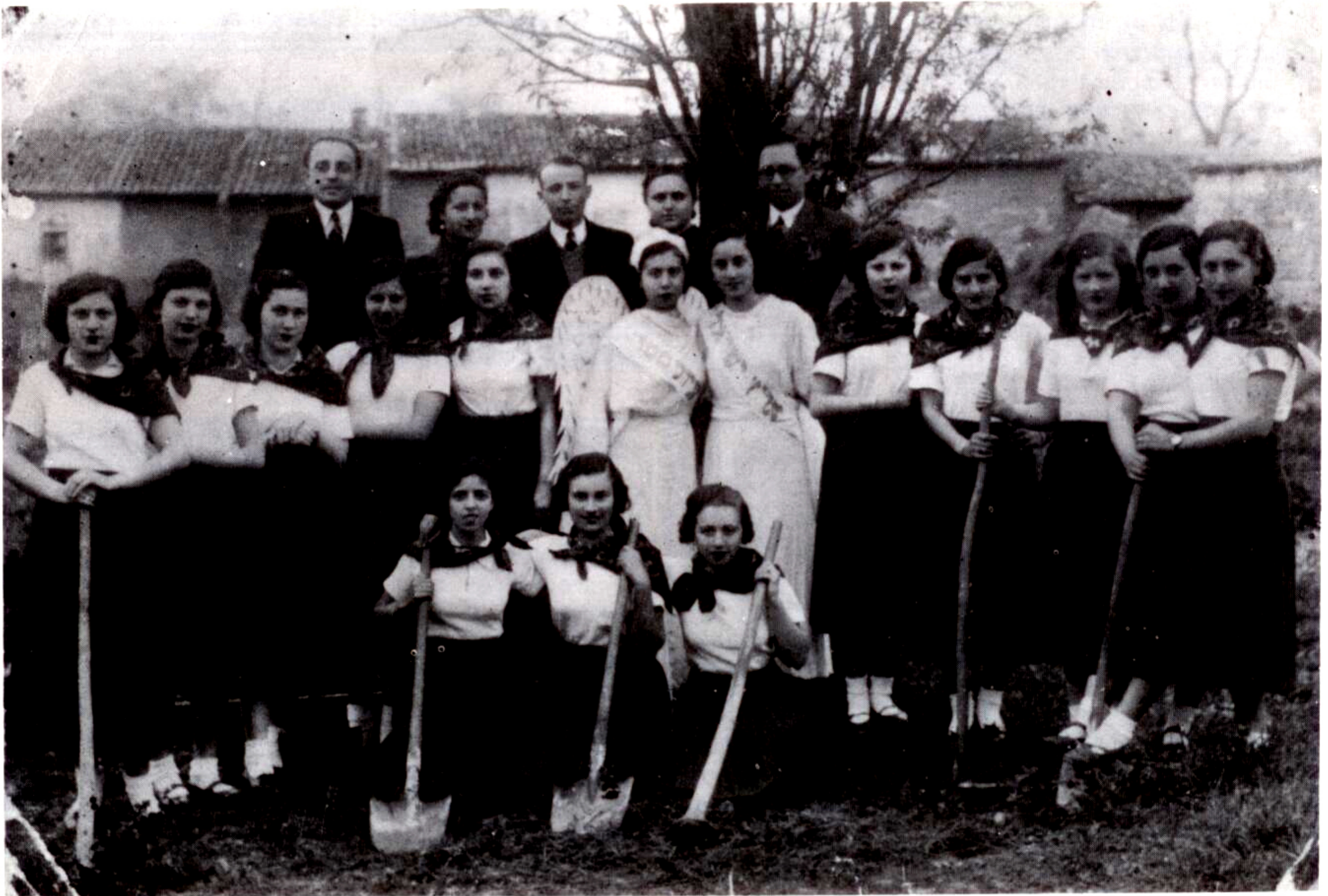
Ένθυμιον έορτής του Πουρίμ, του Συλλόγου «Άχδούτ» Κομοτινής (1937).

Τό πνεύμα αυτό της συνεργασίας άρχισε από την πρώτη στιγμή πού ή Έννάτη Έλληνική Μερραρχία μαζί μέ τά Γαλλικά Συντάγματα, δύο Πεζικού καί ένα Ιππικού, μέ άρχηγό τόν Γάλλο στρατηγό SARPY, έγκαταστάθηκαν στην Κομοτινή τόν Οκτώβριο του 1919. Τά σπίτια των Ισραηλιτών θεωρήθηκαν κατάλληλα νά φιλοξενήσουν τούς Έλληνες καί τούς Γάλλους άξιωματικούς καί για λόγους άσφαλείας καί για λόγους άνέσεων, αλλά καί γιατί έγνώριζαν την Γαλλική γλώσσα καί ήταν εύκολη ή συνεννόηση. Όταν τόν Μάιο του 1920 παρέμεινε μόνιμα ό Έλληνικός στρατός ή συνεργασία όχι μόνο συνεχίσθηκε αλλά μετατράπηκε σε πραγματική φιλία, πρό πάντων όταν έφθασε στην Κομοτινή ό διορισθείς από την Κοινωνία των Έθνών Πρόεδρος της Έπιτροπής Άποκαταστάσεως Προσφύγων, Έρρίκος Μοργκεντάου, πού λόγω της Έβραϊκής του καταγωγής φιλοξενήθηκε από την Ισραηλιτική Κοινότητα καί συγκεκριμένα από τούς κυρίους Χαίμ Νεφούση καί Γιονά Ρωμάνο.