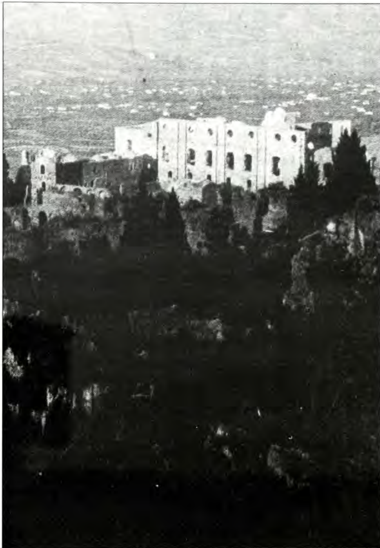
Πυργόσπιτα στη Μέσα Μάνη.

Η αποβίβασις του περιηγητού, κατά την αφήγησή του, έγινεν εις το Γύθειον τον Μάιον του 1668. Απ' εκεί με υποζύγιον ώδευσεν εις το εσωτερικόν της Λακωνίας με κύριον σταθμόν του ταξιδίου το Μυστράν, προς τον