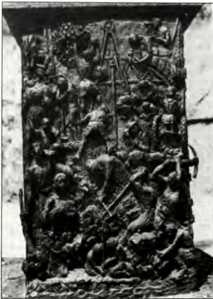
Παράσταση που συμβολίζει την ανοικοδόμηση του Ισραήλ από τους σκαπανείς.

Ο αγιασμός του Σαββάτου, που αναγνωρίζει δικαίωμα ανάπαυσης και στους δούλους και στα ζώα (Εξοδ. 23:12) είναι μια ακόμη θεμελιώδης αρχή, που πέρα από την αυτονόητη κοινωνική και ανθρωπιστική