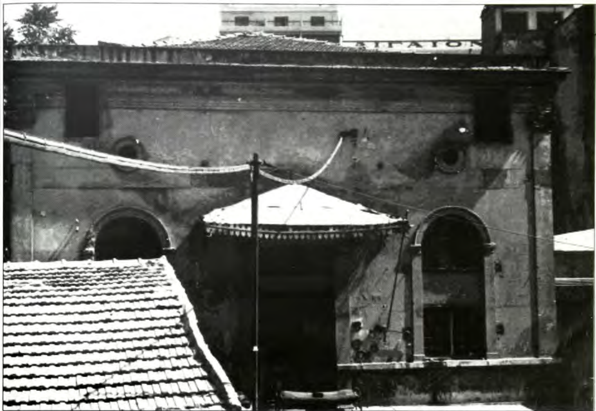
Θεσσαλονίκη: Παλιά Συναγωγή "Κιάνα", επί της οδού Βαλαωρίτου 9. Σήμερα έχει κατεδαφισθεί.