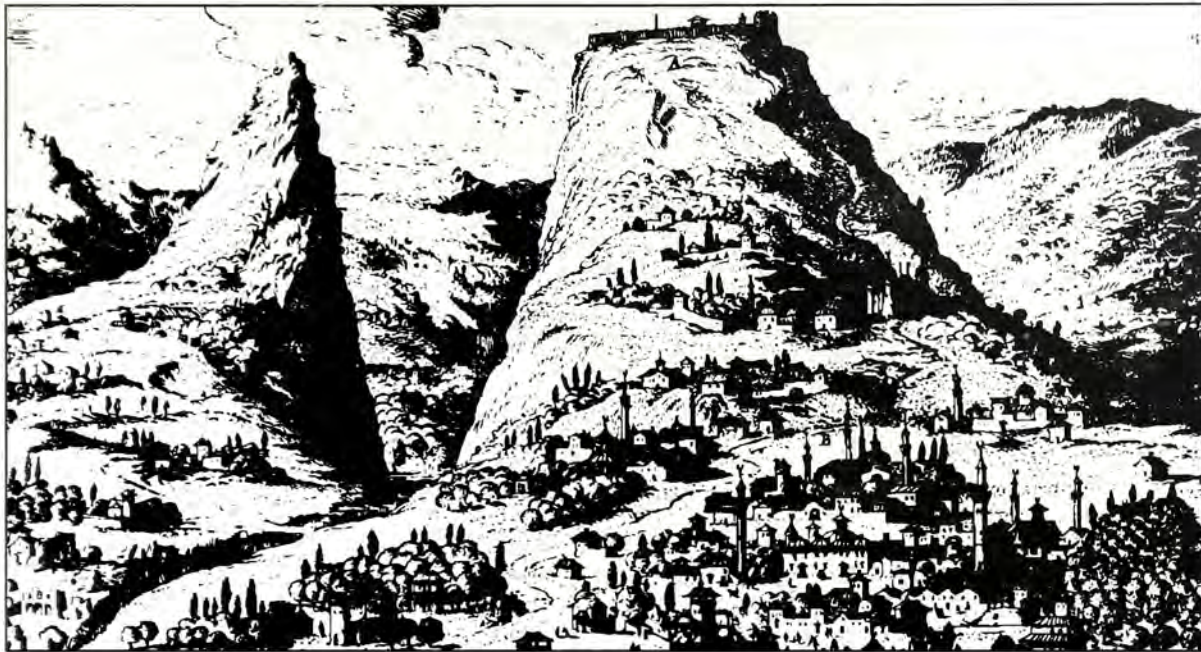
Ο Μυστράς σε παλιά γκραβούρα