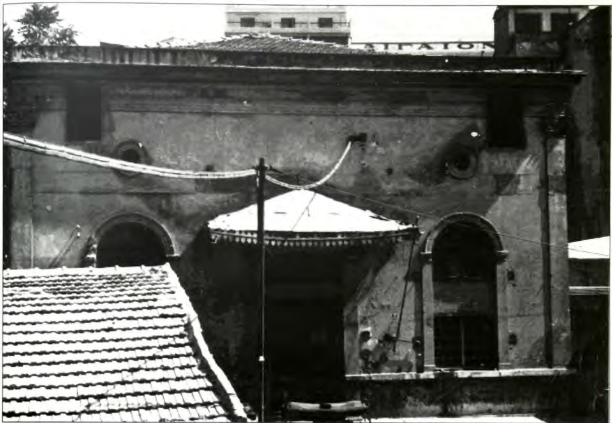
Θεσσαλονίκη: Παλιά Συναγωγή "Κιάνα", επί της οδού Βαλαωρίτου 9. Σήμερα έχει κατεδαφισθεί.