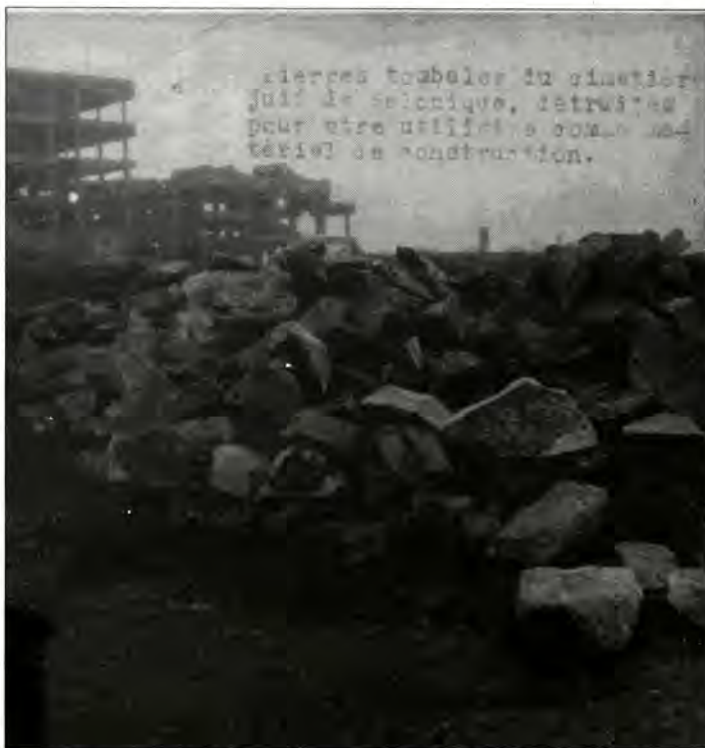
Θεσσαλονίκη: Πέτρες ταφικών μνημείων από το παλιό εβραϊκό νεκροταφείο που έχουν χρησιμοποιηθεί ως υλικό οικοδομών.