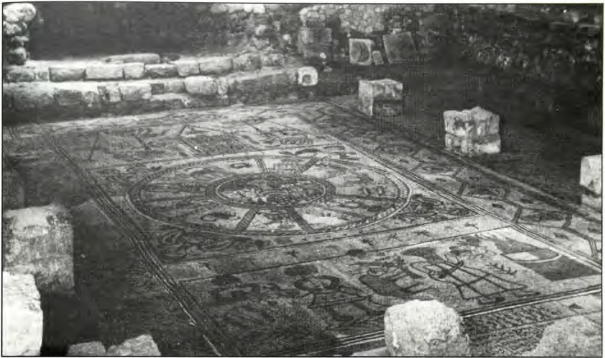
Μωσαϊκό δάπεδο από αρχαία συναγωγή στη Μπετ Άλφα. Παριστάνει τον ζωδιακό κύκλο.