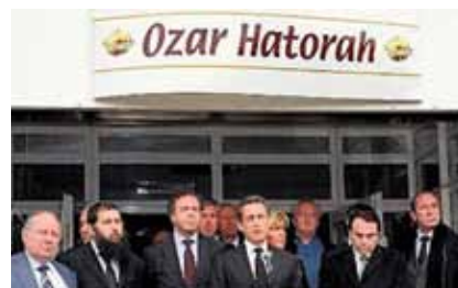
Ο Γάλλος Πρόεδρος Ν. Σαρκοζί, με τοπικούς παράγοντες και εκπροσώπους της εβραϊκής κοινότητας, στο σχολείο «Οζάρ Ατορά».