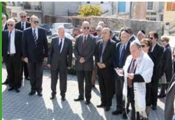
Στιγμιότυπο από την επιμνημόσυνη δέηση στο Μνημείο Ολοκαυτώματος.