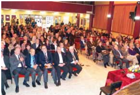
Από την εκδήλωση στο Σύλλογο «Σκουφάς».