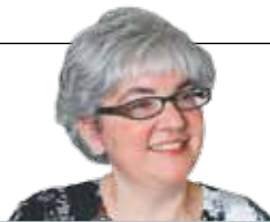
ΤΗΣ ΟΝΤΕΤ ΒΑΡΩΝ-ΒΑΣΑΡ