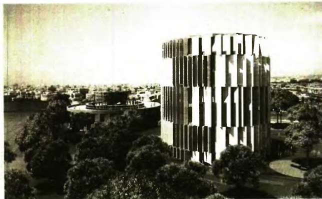
Μακέτα του έργου.

Από την πλευρά του ο Γιάννης Μπουτάρης, πρόεδρος του δ.σ. του Ιδρύματος Μουσείου Ολοκαυτώματος Ελλάδος και πρώην δήμαρχος Θεσσαλονίκης, τονίζει στη «ΜτΚ» ότι για να εκπονηθούν οι μελέτες, πρέπει να οριστικοποιηθεί η υπογραφή της απόφασης του δήμου και μετά