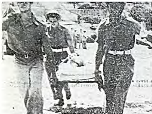
Άνδρες των Ισραηλινών πολεμικών πλοίων τα οποία έφθασαν εκ των πρώτων εις τον τόπον της καταστροφής μεταφέροντες τραυματίες. («Τα Νέα», 24/8/1953)