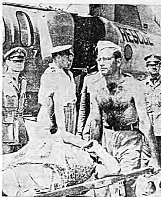
Και άλλο στιγμιότυπο από την ξένη βοήθεια προς τους σεισμοπαθείς του Ιονίου: Νοσοκόμοι του Ισραήλ μεταφέρουν εις αμερικανικόν ελικόπτερον μίαν έγκυον Αργολιπίτισσαν. («Ακρόπολις», 16/8/1953)

Και κάτω από τα ερείπια, μέ- σα σε κατώγια, στα μπουλεβάρια, τα γουλόστρω- τα, τις ανηφόρες, τα βόρτα, τα καντούνια, που ο απόηχος της κιθάρας και της αριέτας δεν είχε σβύσει ακόμα, η ζωή σφάδαζε, λα-