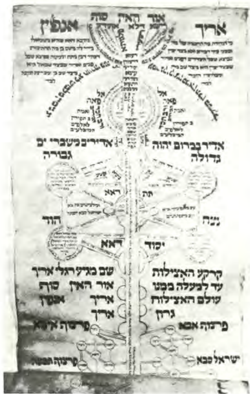
Χειρόγραφο σχεδιάγραμμα του «δένδρου των Σεφί- ρότ», που κατά την Καββαλιστική θεωρία παρουσιάζ- ει τα δέκα στάδια της δημιουργίας του κόσμου. Γερ- μανία 18ος αιώνας.

ναν ορισμένες παρακινδυνευμένες παραχωρήσεις πρός την άριστοτελική θεωρία της αιωνιότητας της ύ- λης. Ο Γεουντά Άλεβή (1086 - 1145), επέκρινε με δριμύτητα αυτή την τάση και ως αντίθετη με τη λογι- κή και διότι περιορίζει την παντοδυναμία του Θεού.