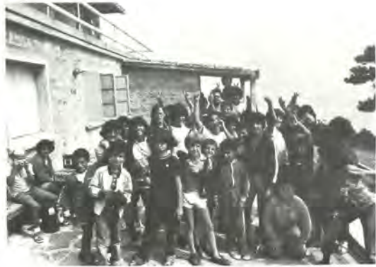
‘Αριστερά: Πρόβα του θεατρικού club. Δεξιά: Χαρούμενα τὰ παιδιά πού κατόρθωσαν ν’ ἀνέβουν στό Α΄ κα- ταφύγιο του ‘Ολύμπου.

καθώς καί μία ομάδα δημοθέσμων φοιτητῶν καί σπουδαστῶν. Οἱ μέρες πέρασαν γρήγορα μέσα ἀπό μία ποικιλία ἐντυπώσεων καί ἐμπειριῶν πού προκάλεσαν ἡ μύηση καί ἡ τήρηση τῶν παραδόσεων τῆς θρησκείας, τὰ καθημερινά μπάνια στή θάλασσα, οἱ ὀργανωμένες ψυχαγωγικές ἐκδηλώσεις, τὰ παιχνίδια, οἱ ἐκδρομές στόν ‘Ολυμπο, τὰ μαθήματα χειροτεχνίας, οἱ ἀθλητικοί ἀγῶνες καί ἡ παρακολούθηση τῶν παραστάσεων τοῦ «Φεστιβάλ ‘Ολύμπου» 1979.