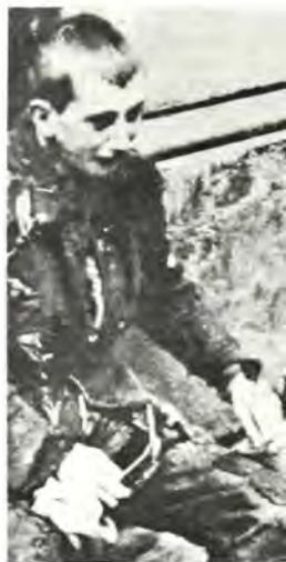
Έπάνω: Ένα ρακένδυτο παιδί, που συνελήφθει ενώ προσπαθούσε να κλέψει τρόφιμα, από μια ύπαιθρια αγορά, τον Άπριλιο του 1943. Δεξιά: Ένας Έβραϊός επιστρατευμένος για καταναγκαστική εργασία μεταφέρει στο νεκροτομείο τό πτώμα ενός νεογέννητου.