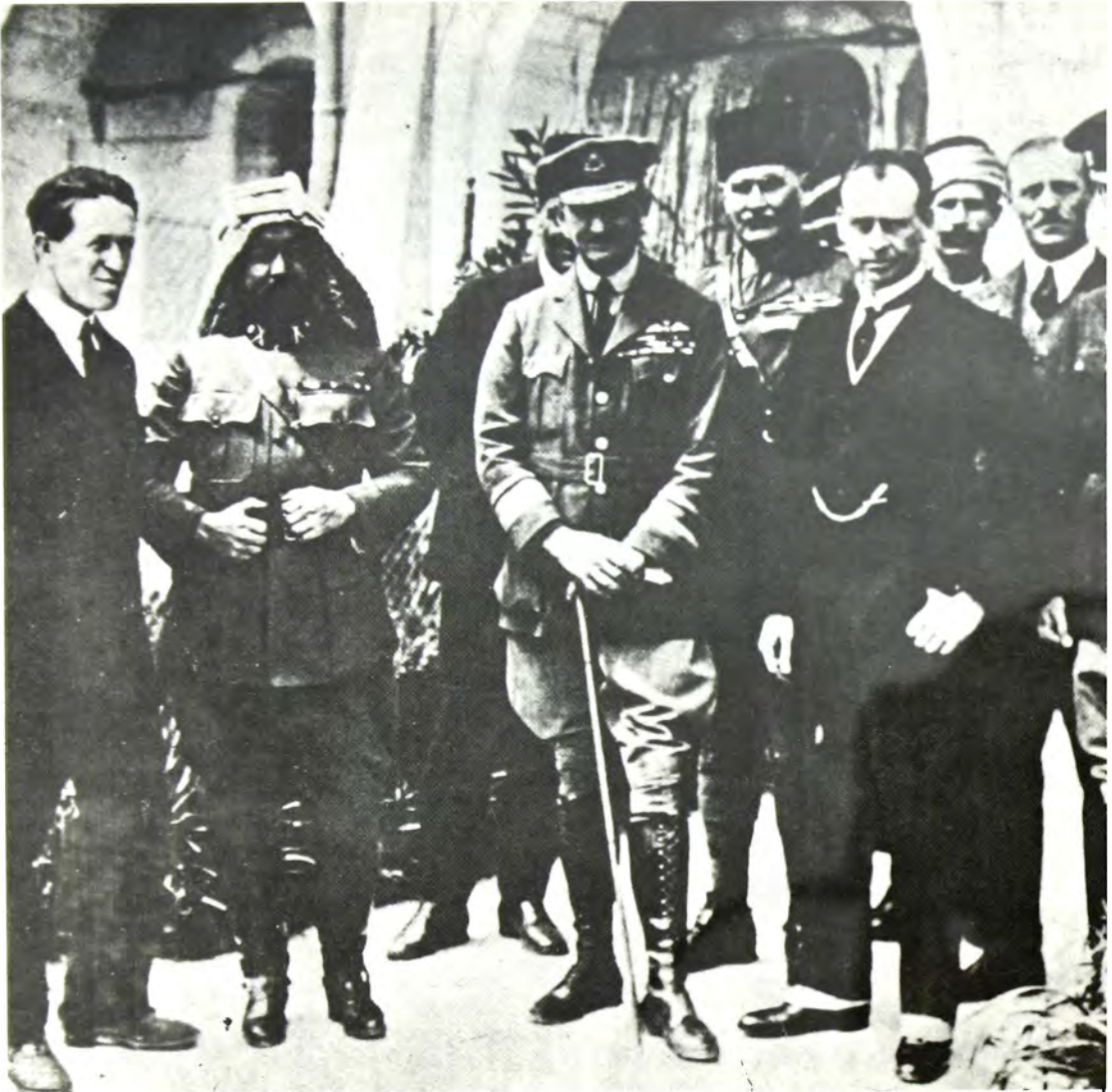
Ο συνταγματάρχης Λώρενς (πρώτος άριστερά) με τον έμíρη Άβδουλλάχ και τό Βρεταννικό Γενικό Έπτελείο στην Ύπεριορδάνια