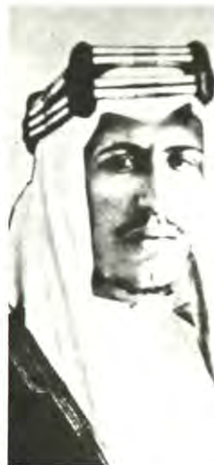
Ὁ ἐμίρης Φεϋζάλ (ἐπάνω) καὶ ὁ δόκτωρ Βάιτμαν (κάτω), πρόεδρος τῆς Σιωνιστικῆς Ἐκτελεστικῆς Ἐπιτροπῆς. Οἱ δύο ἄνδρες προσπάθησαν, πρὶν ἀπὸ ἐξήντα χρόνια, νὰ βροῦν τρόπο συνεννόησεως μὲ τὴν ὑπογραφή συμφωνίου.

Οἱ ὄροι τῆς συμφωνίας ἀπηχοῦσαν μίαν ἀνώτερη ἠθικὴ καὶ ἀντικατόπτριζαν τὴν ἐ-