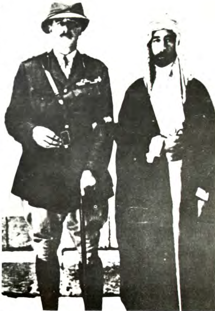
Ό Βρεταννός στρατηγός Άλλενμπυ καί ό Φεϋζάλ, πού οι Άγγλοι άνέβασαν στό θρόνο του Ίράκ.

Ό Άβδουλλάχ ήθελε νά έκμεταλλευθεί γιά τόν έαυτό του τή χειρονομία αυτή τής Θείας Πρόνοιας. Καί τί δέν θά έδινε γιά νά άναγνωρίσουν τήν έξουσία του οι Έβραίοι. Τούς ύποσχόταν πολλά προνόμια