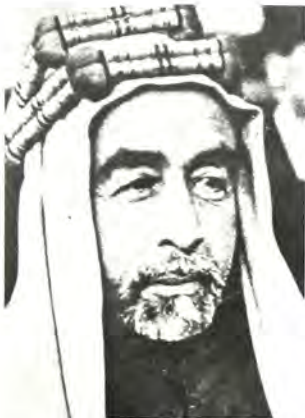
Ό έμίρης Άβδουλλάχ τής Υπεριωρδανίας και ή Γκόλντα Μείρ: Οι συνηνεήσεις τους άπέβησαν άκαρπες.

Στό ύπόμνημά της, πού υπέβαλε στίς 29 Ίανουαρίου 1919, ή άντιπροσωπεία τής Χετζάζης έξείρασε τήν Παλαιστίνη από τίς διεκδικήσεις της. Τό ίδιο έκανε και ό έμίρης Φεϋζάλ όταν, στίς 6 Φεβρουαρίου 1919, έπικεφαλής τής άντιπροσωπείας του, στήν όποία έπαιρνε μέρος και ό Λώρενς τής Άραβίας, έμφανίσθηκε μπροστά στήν Έπιτροπή των Πέντε. Πιο συγκεκριμένη άκόμη ήταν ή συριακή άντιπροσωπεία. «Η Παλαιστίνη», δήλωσε στίς 13 Φεβρουαρίου ό Χεκρί Γκαλέμ. «είναι άναμφισβήτητο τμήμα τής Νότιας Συρίας. Τήν διεκδικούν οι σιωνιστές. Έχουμε ύποστεί πολλά δεινά όμοια με τά δικά τους. Δέν μπορούμε νά μήν τούς άνοιξουμε διάπλατα τίς πύλες τής Παλαιστίνης. Άς έγκατασταθούν στήν Παλαιστίνη αλλά σέ μία Παλαιστίνη άυτόνομη, δεμένη με τήν Συρία μόνο με τά δεσμά μιάς όμοσπονδίας».