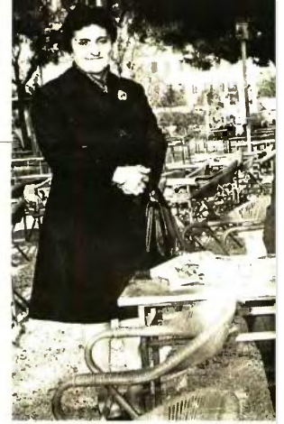
Φοιτητής Ιατρικής, με τους γονείς του

«Αν ξεκινούσα από την αρχή, θα μάθαινα μουσική και πολλές γλώσσες, αυτά είναι τα δύο απωθημένα που έχω» λέει ο δήμαρχος Ιωαννίνων Μωυσής Ελισάφ