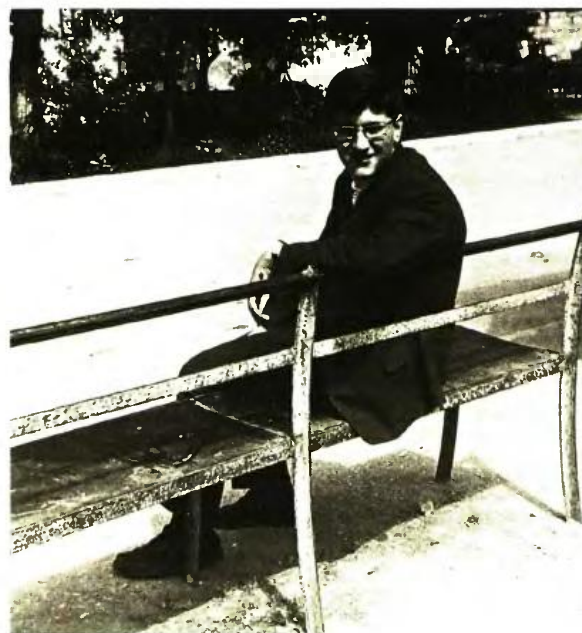
Την Πρωτομαγιά του 1971, στον Κατοικά Ιωαννίνων

Σαφώς, ήταν κάτι που μου πέρασαν οι γονείς. Ο πατέρας μου ήταν έμπο-