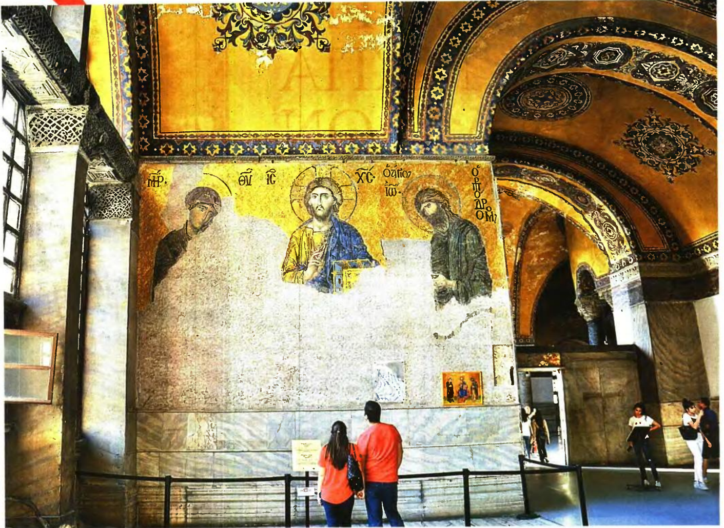
Επισκέπτες μπροστά στο ψηφιδωτό της Δεήσεως, με την Παναγία και τον Ιωάννη Πρόδρομο να ικετεύουν για τη φιλευσπλαχνία του Κριτή κατά την τελική Κρίση