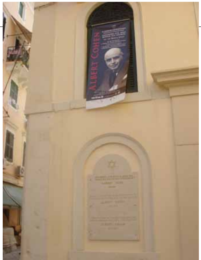
Η αφίσα των εκδηλώσεων στη Συναγωγή Κέρκυρας.

Το αφιέρωμα κορυφώθηκε με διήμερο Διεθνές Συ-