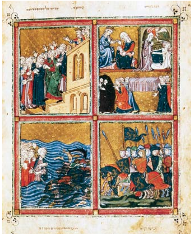
Η Έξοδος από την Αίγυπτο. Εικονογράφηση χειρογράφου, Ισπανία 1320

Τον καιρό που ο Σαμουήλ ήταν Κριτής, ο λαός συγκεντρώθηκε για να του ζητήσει να ορίσει έναν βασιλιά να τους κυβερνά, «καθώς έχουσι πάντα τα έθνη» 46 . Με άλλα λόγια του ζήτησαν ένα μόνιμο θεσμό, ο οποίος θα χειριζόταν τα πολιτικά, τα στρατιωτικά και άλλα θέματα που τους αφορούσαν. Εάν επιτραπεί ένας συσχετισμός με τη σύγχρονη εποχή θα μπορούσε να ισχυρισθεί κανείς ότι ο λαός έκανε χρήση του δικαιώματός του στην αυτοδιάθεση, δηλαδή στο δικαίωμά του να επιλέξει το σύστημα διακυβέρνησης. Η επιθυμία των Εβραίων να έχουν μοναρχικό και όχι