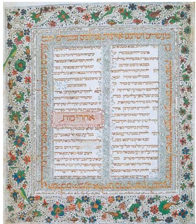
Εικονογραφημένη Βίβλος, Πορτογαλία 1482. Τμήμα των 613 βιβλικών εντολών.

Μερικές φορές οι Εβραίοι εμπλέκονταν άθελά τους σε εχθροπραξίες μεταξύ τρίτων χωρών. Και άλλες φορές μάχονταν ξένα κράτη επιζητώντας εκδίκηση για το κακό που είχαν προκαλέσει σε ομόθρησκό τους. Ωστόσο δεν μπορεί να είναι κανείς σίγουρος για το εάν αυτό δεν αποτελούσε παρά μόνο την αφορμή για να επιτεθούν και να λεηλατήσουν άλλα κράτη. Οι αφηγήσεις από το βιβλίο της Γενέσεως που ακολουθούν είναι χαρακτηριστικές.