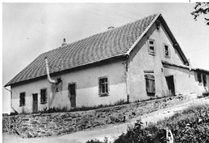
Θάλαμος αερίων του στρατοπέδου Natzweiler.