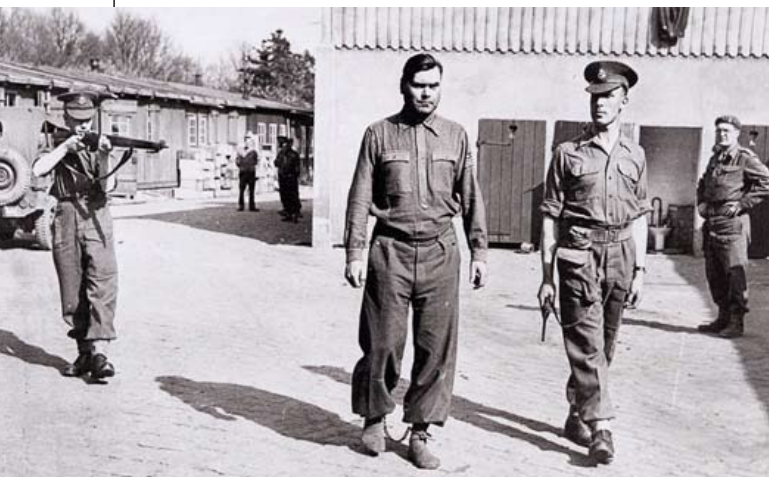
Ο J. Kramer, διοικητής του Natzweiler, κατά τη σύλληψη του από τους Βρετανούς.

1943 στο Άουσβιτς. Στις 4 Μαΐου 1943, έφθασαν εκεί μ' αυτήν την αποστολή 2.930 Εβραίοι άνδρες, γυναίκες και παιδιά. Μετά τη «διαλογή», 220 άνδρες και 318 γυναίκες εστάλησαν στο στρατόπεδο ως κρατούμενοι, ενώ τα υπόλοιπα 2.392 άτομα εξοντώθηκαν αμέσως στους θαλάμους αερίων. Στις 30 Ιουλίου 1943 εκτοπίστηκε στο στρατόπεδο συγκέντρωσης Natzweiler-Struthof. Εκεί, δολοφονήθηκε στους θαλάμους αερίων στις 17 ή στις 19 Αυγούστου 1943.