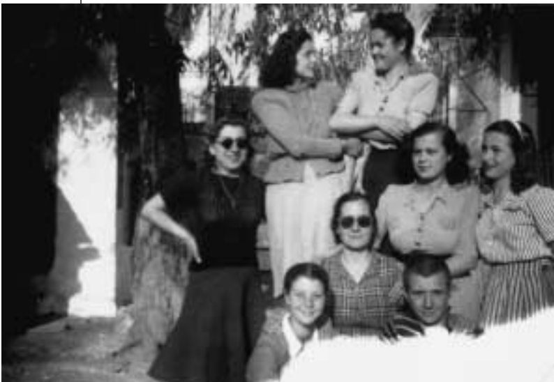
1948: Στην αυλή της Συναγωγής δίπλα στο πηγάδι. (Αρχειο Νίτσας Αρταβάνη - Γερογιάννη).

Επαγγελματικό Οδηγό Θεσσαλίας και Ηπείρου, που κυκλοφόρησε το 1939, αναγράφονται 33 εβραϊκά ονόματα.