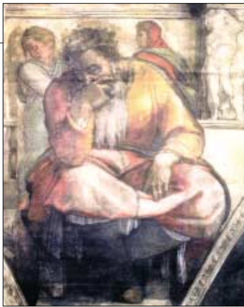
Ο προφήτης Ιερεμίας. Τμήμα της μεγάλης νωπογραφικής σύνθεσης του Μικαήλ Αγγέλου (1475-1564) στην οροφή της Καπέλα Σιέτινα. Ρώμη, Βατικανό.

Το περιορισμένο του χώρου δεν επιτρέπει να αναφερθούμε στις διακυμάνσεις που πέρασε η προφητεία μέχρι να φθάσει στα υψηλότερα επίπεδά της, τότε που ο προφήτης δεν εξέφραζε απλώς τη γνώμη του για τα ε-