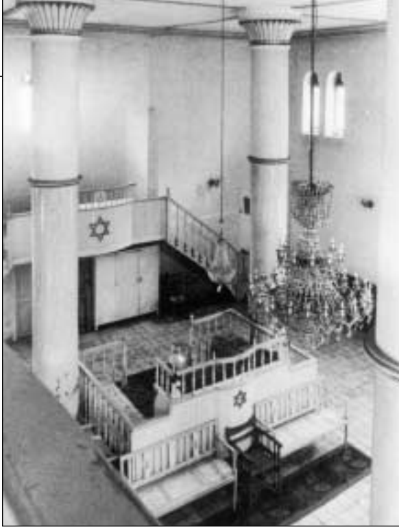
Εσωτερικό της Συναγωγής Τρικάλων, όπως είναι σήμερα.