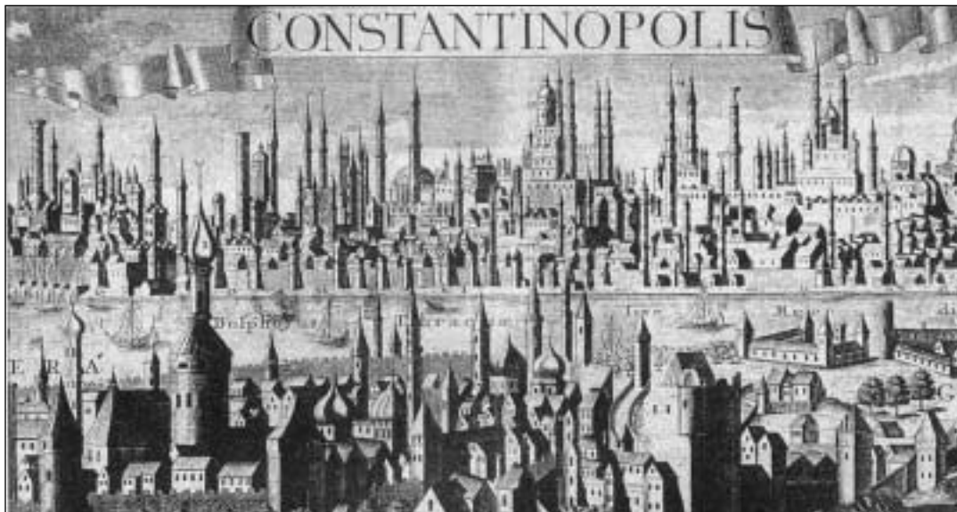
Γενική άποψη της Κωνσταντινούπολης, με πρώτο πλάνο την περιοχή του Πέραν και του Γαλατά και τον Βόσπορο να διαχωρίζει την ανατολική από την ευρωπαϊκή Τουρκία. Στο βάθος τα μνημεία της Κωνσταντινούπολης, κοσμικά και θρησκευτικά. Χαλκογραφία του Johann Friedrich Probst