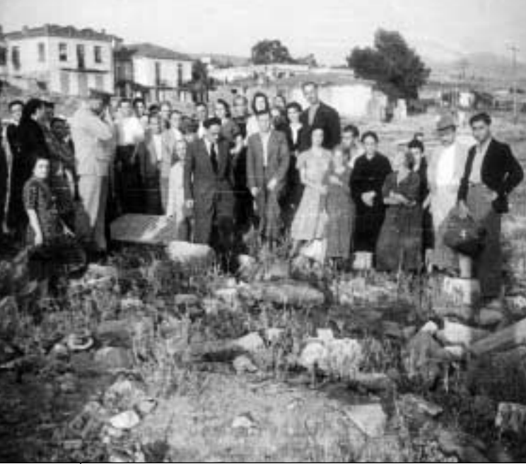
Προσκήνυμα στο κατεστραμμένο εβραϊκό νεκροταφείο Θεσσαλονίκης, μεταπολεμικά.