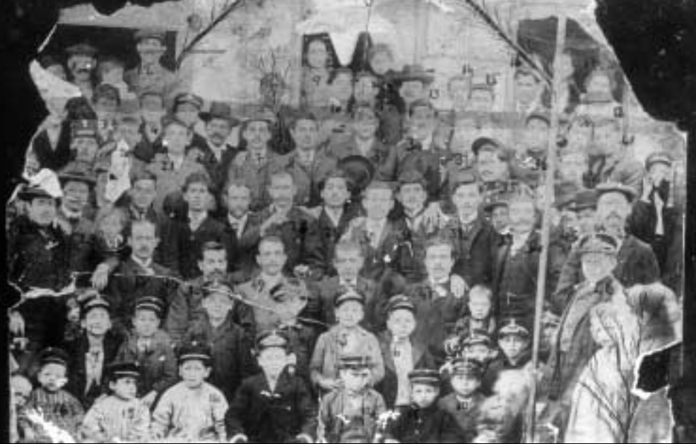
Παλιά φωτογραφία μελών της τότε Ισραηλιτικής Κοινότητας Τρικάλων.