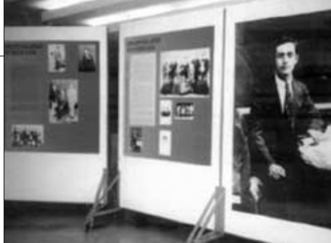
Άποψη από την έκθεση που επιμελήθηκε το Εβραϊκό Μουσείο Ελλάδος.

Οι αρχές των Ιωαννίνων, πνευματικά τοπικά ιδρύματα, σύλλογοι και η Ισραηλιτική Κοινότητα Ιωαννίνων συνεργάστηκαν για να τιμήσουν τον Γιαννιώτη Ελληνοεβραίο ποιητή, δάσκαλο και λόγιο Γιοσέφ Ελιγιά, με σειρά πολιτιστικών εκδηλώσεων που έγιναν στη γενέτειρά του. Το πρόγραμμα των εκδηλώσεων, που ξεκίνησε στις 16.12.01 και συνεχίστηκε μέχρι τις 12.1.02, είχε ως γενικό τίτλο «Γιοσέφ Ελιγιά: Επιστρέφοντας στα Γιάννενα» και σηματοδότησε τα 100 χρόνια από τη γέννηση και τα 70 από το θάνατο του ποιητή.