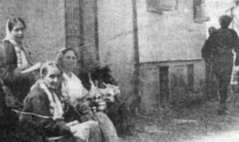
Δρόμος στην περιοχή του Βαρδάρη. Εβραίοι κάθονται σε ψάθινες καρέκλες μπρος στην είσοδο του σπιτιού τους. Στην περιοχή αυτή υπήρχε εβραϊκή γειτονιά με φτωχικά σπίτια και τρεις συναγωγές!