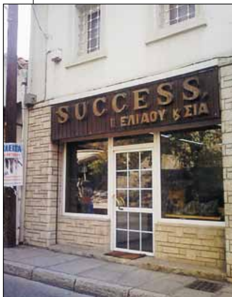
Το κατάστημα Ελιάου, η τελευταία εβραϊκή επιχείρηση της Καστοριάς.

ΣΗΜΕΙΩΣΗ: Το κείμενο αυτό δημοσιεύτηκε στο περιοδικό «Συλλογές», τ. 210/2002 και στην εφημερίδα «Οδός» της Καστοριάς, φ. 341/2006. Ο συγγραφέας εκπονεί μελέτη για την ιστορία των Εβραίων της Καστοριάς.