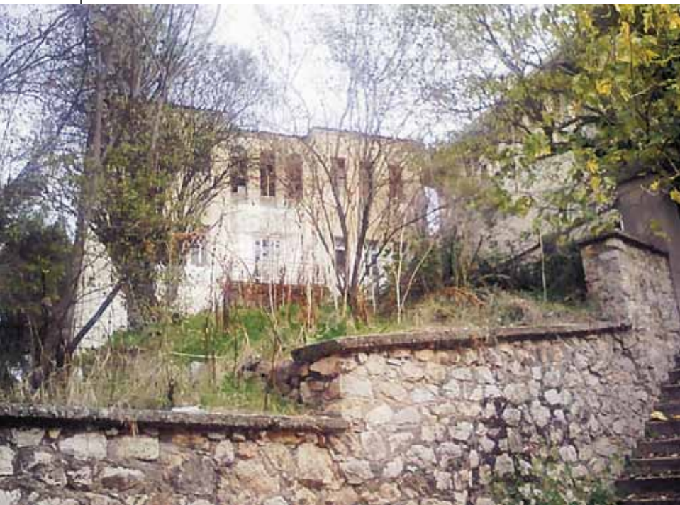
Ο χώρος φύλαξης των Εβραίων της Καστοριάς τον Μάρτιο του 1944 πριν την εκτόπισή τους.

Κ ατά μια εκδοχή από τα χρόνια του Ιουστινιανού, οπότε και ιδρύθηκε η πόλη, οπωσδήποτε όμως από το 10ο ήδη αιώνα μαρτυρείται ιστορικά η εγκατάσταση ελληνόφωνων Εβραίων εμπόρων στην Καστοριά, οι οποίοι γρήγορα σχημάτισαν μια πρώτη ρωμανιωτική κοινότητα. Κοινότητα που απέκτησε πνευματική λάμψη και ανάπτυξη αναδεικνύοντας σπουδαίους ραβίνους και μελετητές της Βίβλου, σημαντικότερος των οποίων αναφέρεται ο Τοβία μπεν Ελιέζερ.