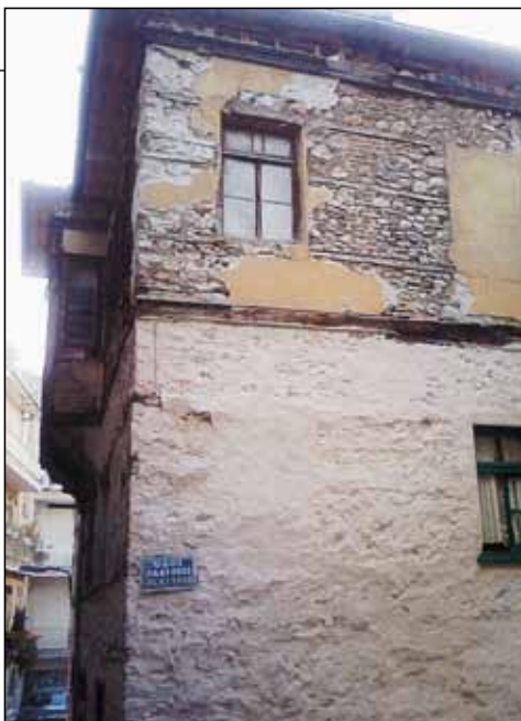
Καστοριά: Μνήμες Εβραϊκής Συνοικίας.

Επιπλέον, καθώς το άλλοτε νεκροταφείο της κοινότητας στην πηγή της Ντόμπλιτσας έχει εξαφανι-