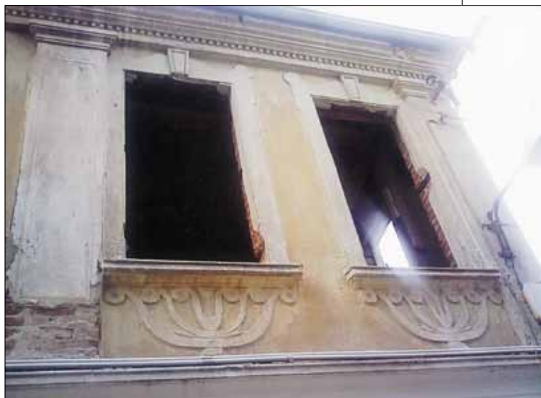
Καστοριά: Σπίτι με Μενορά.

Στα χρόνια μετά το 1912 και την ενσωμάτωση της πόλης στον ελληνικό κορμό, οι Εβραίοι της Καστοριάς, εγκατεστημένοι κυρίως στη συνοικία Τσαρσί, διατηρούσαν σειρά ανθρών επιχειρήσεων και καταστημάτων στην Πάνω και στην Κάτω Αγορά, με αντικείμενο τόσο τους παραδοσιακούς κλάδους στους οποίους δραστηριοποιούνταν οι Εβραίοι της