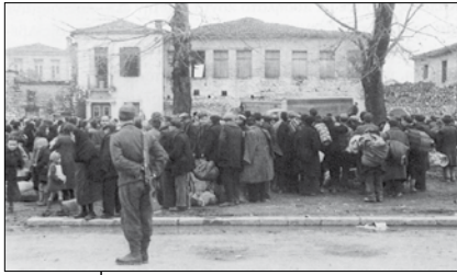
Ιωάννινα, 25 Μαρτίου 1944: Μέχρι 40 κιλά χειραποσκευές ανά εβραϊκή οικογένεια.

γονότα που διεκτραγωδούνται παρά τον τοπικό χαρακτήρα τους είναι πανομοιότυπα, ως καταστάσεις και πνεύμα, με όσα συνέβησαν και στις λοιπές ελληνικές εβραϊκές κοινότητες. Κι αυτό είναι φυσικό γιατί παντού εφαρμόστηκε η ίδια τακτική όπως σαφώς και με κάθε λεπτομέρεια είχε προσδιοριστεί από την οργανωμένη «Τελική Λύση» των χιτλερικών. Όσο κι αν σε κάθε πόλη / περιοχή ίσχυαν προσωπικές φιλίες, ατομικές / οικογενειακές σχέσεις, πνεύ-