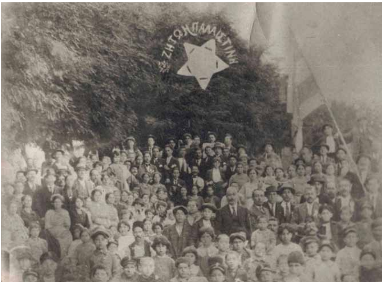
Τρίκαλα 1918: Η Ισραηλιτική Κοινότητα γιορτάζει τη διακήρυξη Μπάλφορ (1917) για την υποστήριξη της Βρετανίας στην «εγκαθίδρυση στην Παλαιστίνη εθνικής κοιτίδας του εβραϊκού λαού». (Αρχείο Βαρούχ Βαρούχ).

Δυο μήνες αργότερα η εφημερίδα «Οι Εργάται» θα συγχαρεί τον Σίδη διά τας αόκνους και αποτελεσματικές αυτού προσπαθείας προς επίρρωσιν ιδίως παρά τοις ομοθρήσκοις αυτού των αισθημάτων του