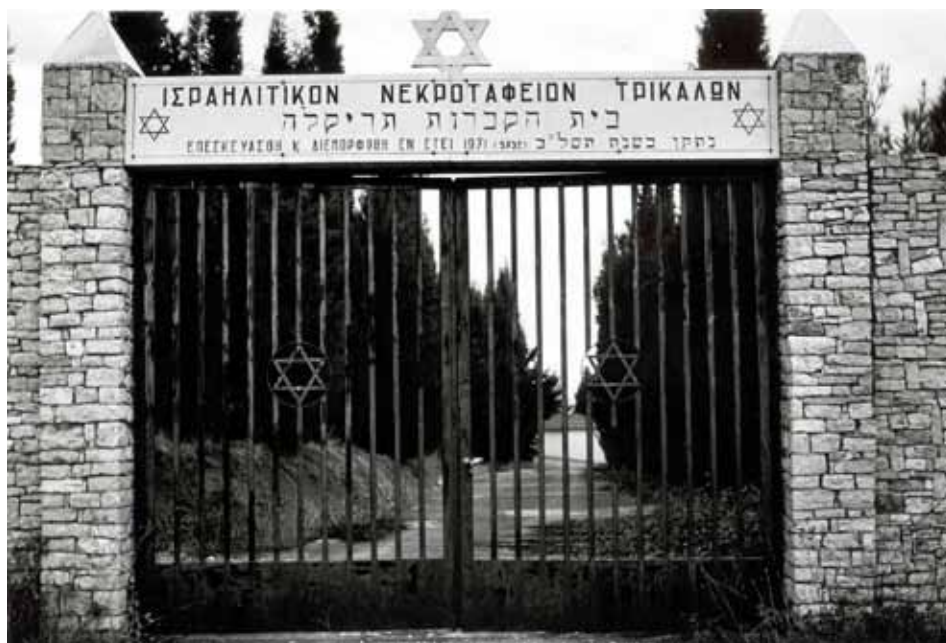
Η είσοδος του εβραϊκού νεκροταφείου.

Τον Φεβρουάριο του 1929 ο Σιωνιστικός Σύλλογος οργάνωσε στο «Πανελλήνιον» χοροεσπερίδα, η οποία εντυπωσίασε τόσο, ώστε η εφημερίδα «Θάρρος» έγραψε: Άξιον παρατηρήσεως είναι το φιλόπονον και ευγενές της προσπάθειας των συμπολιτών Ισραηλιτών εις κάθε ζήτημα φιλοπρόδον και κοινωνικόν. Δεν εφίσθησαν κόπων ουδέ δαπανών, όπως ποικίλουν την χοροεσπερίδα και με πρωτότυπα πράγματα. Η πρωτοτυπία συνίστατο στο ότι, κατά τα διαλείμματα του χορού, μια ομάδα νεαρών κοριτσιών και αγοριών, υπό την