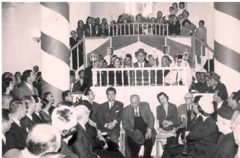
Γιορτή στη Συναγωγή με τη συμμετοχή φίλων Χριστιανών (φωτ. δεκαετίας του 1950).

Ο τοπικός Τύπος επαινεί πολύ συχνά τα φιλανθρωπικά αισθήματα του Μεγήρ, ο οποίος έχει ανακηρυχθεί και ευεργέτης του Γυμναστικού Συλλό-