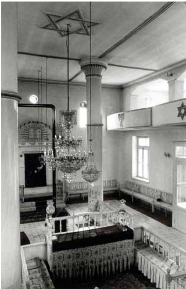
Το εσωτερικό της Συναγωγής.

Τον Γενάρη του 1937, η προβολή της κινηματογραφικής ταινίας με τίτλο «Η γη της επαγγελίας», στον κινηματογράφο της πόλης «Τιτάνια», θα δώσει την αφορμή να γραφεί ένα εγκωμιαστικότατο άρθρο για τα επιτεύγματα των Ισραηλιτών της Παλαιστίνης. Ο υπό τα αρχικά Γ. Κ. Ζ. αρθρογράφος, αφού