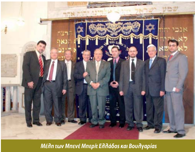
Μέλη των Μπενέ Μπερίτ Ελλάδας και Βουλγαρίας

Τέλος, οι συμμετέχοντες επισκέφθηκαν τον αρχαιολογικό χώρο της Βεργίνας.