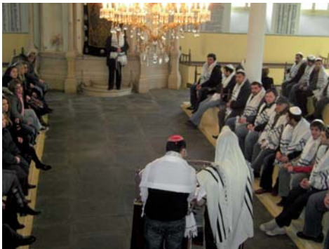
Στιγμιότυπο από τη λειτουργία στη Συναγωγή