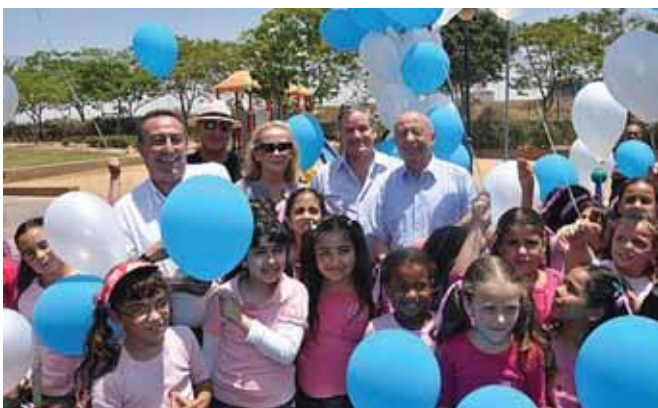
Από τη δράση του Κ.Η.

Στα πλαίσια του Συνεδρίου έγιναν ειδικές τιμητικές εκδηλώσεις, για αποχωρούσες προσωπικότητες από την ενεργό δράση στο Keren Hayesod, που με