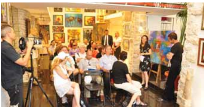
Επάνω: Εγκαίνια παιδικής χαράς. Κάτω: Έκθεση νέων μεταναστών καλλιτεχνών

την προσφορά και την υποστήριξη τους έχουν συμβάλει ουσιαστικά στο έργο του. Στις εκδηλώσεις αυτές παραβρέθηκαν υπουργοί, βουλευτές και εξέχουσες προσωπικότητες από τον πολιτικό, επιστημονικό και καλλιτεχνικό χώρο του Ισραήλ. Το Συνέδριο τελείωσε με εκδήλωση που έγινε στο πρόσφατα ανακαινισμένο Μπεν Χατεφουσότ (Μουσείο της Διασποράς), όπου οι διεθνείς συμμετέχοντες ξεναγήθηκαν στα νέα εκθέματα που προστέθηκαν πρόσφατα στη συλλογή του Μουσείου και παρουσίασαν την ιστορία της μετανάστευσης Εβραίων στη Νορβηγία μεταξύ του 1851-1945 καθώς και μία πρωτοποριακή έκθεση φωτογραφίας.