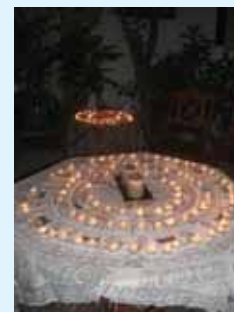
276 κεριά στη μνήμη των Εβραίων των Χανίων

Η απουσία ονομάτων στις μεγάλες ταφόπληκες που κάλυψαν τους τάφους αποτελεί σαφή ένδειξη ότι πρόκειται για ανθρώπους που χάθηκαν κατά την περίοδο 1941-1944, κατά τη διάρκεια της ναζιστικής κατοχής στα Χανιά, κατά την οποία θα ήταν πράγματι αδύνατον να κατασκευαστούν μνημεία με κανονικές εβραϊκές επιγραφές. Υπάρχει η πιθανότητα τα ονόματα των νεκρών να ήταν χαραγμένα κάτω από τις πλάκες, αλλά δεν υπάρχει κανένα ίχνος αυτών σήμερα. Επειδή στα Χανιά δεν υπάρχει εβραϊκό κοιμητήριο, διερευνήσαμε με την Εβραϊκή Κοινότητα Θεσσαλονίκης τη δυνατότητα να θαφτούν τα λείψανα εκεί, όπως μας πρότεινε ο πρό-