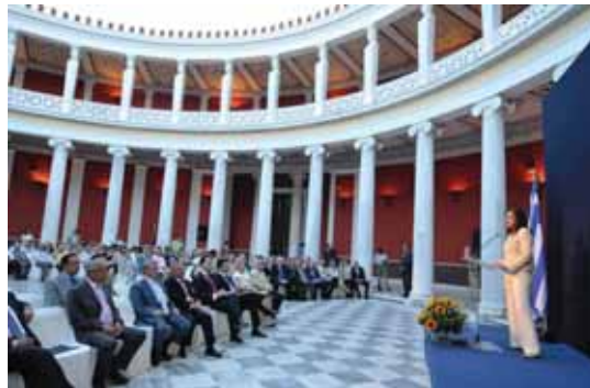
Από την ομιλία της υπουργού Εξωτερικών στην τελετή.

...Κανείς δεν μπορεί να εφησυχάζει μπροστά σε καλυμμένες μεταμορφώσεις του αντισημιτισμού ή στην επαίσχυντη και απροκάλυπτη