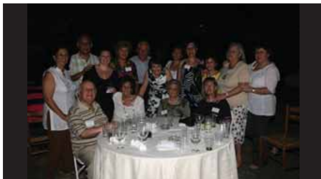
Από τη συνάντηση της οικογένειας Φρανσές

Η ανταπόκριση των μελών της οικογένειας Φρανσές σε αυτό το κάλεσμα ήταν πολύ μεγάλη. Άνθρωποι άγνωστοι στην αρχή μεταξύ τους θυμήθηκαν, προσευχθήκαν και μνημόνευσαν τους κοινούς προγόνους τους και έμαζαν στο χρόνο να βρουν τις κοινές τους ρίζες. Οι στιγμές που μοιράστηκαν τα μέλη της οικογένειας Φρανσές ήταν ιδιαίτερα συγκινητικές γιατί τόσο άνθρωποι μέχρι πρότινος απομακρυσμένοι, αντάλλαξαν εμπειρίες ζωής και αισθάνονται πια ως μία μεγάλη και δεμένη οικογένεια.