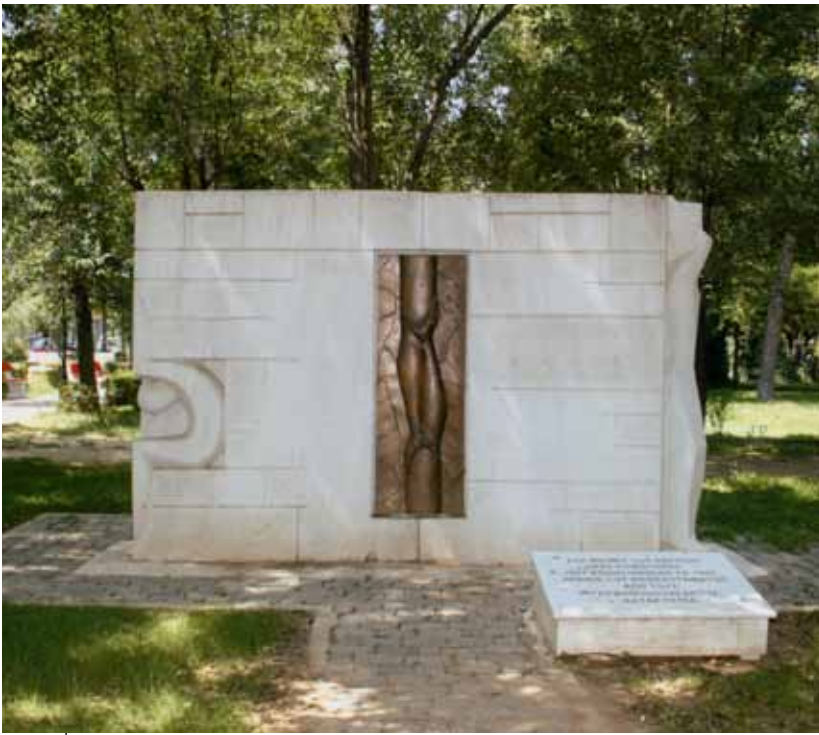
Το Μνημείο Ολοκαυτώματος στην Κομοτηνή