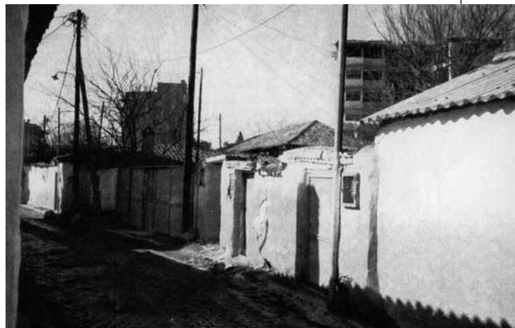
Παλιά σοκάκια της Κομοτηνής.

Εδώ τελείωσε η κουβέντα μου με τον αγαπητό