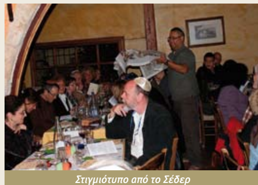
Στιγμιότυπο από το Σέδερ