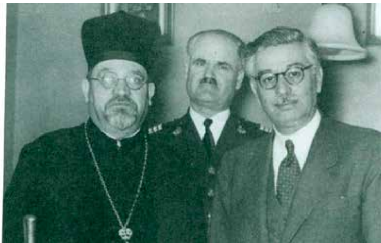
Ο Ελιάου Μπαρζιλάι με τον αρχηγό της Αστυνομίας, Άγγελο Εβερετ.