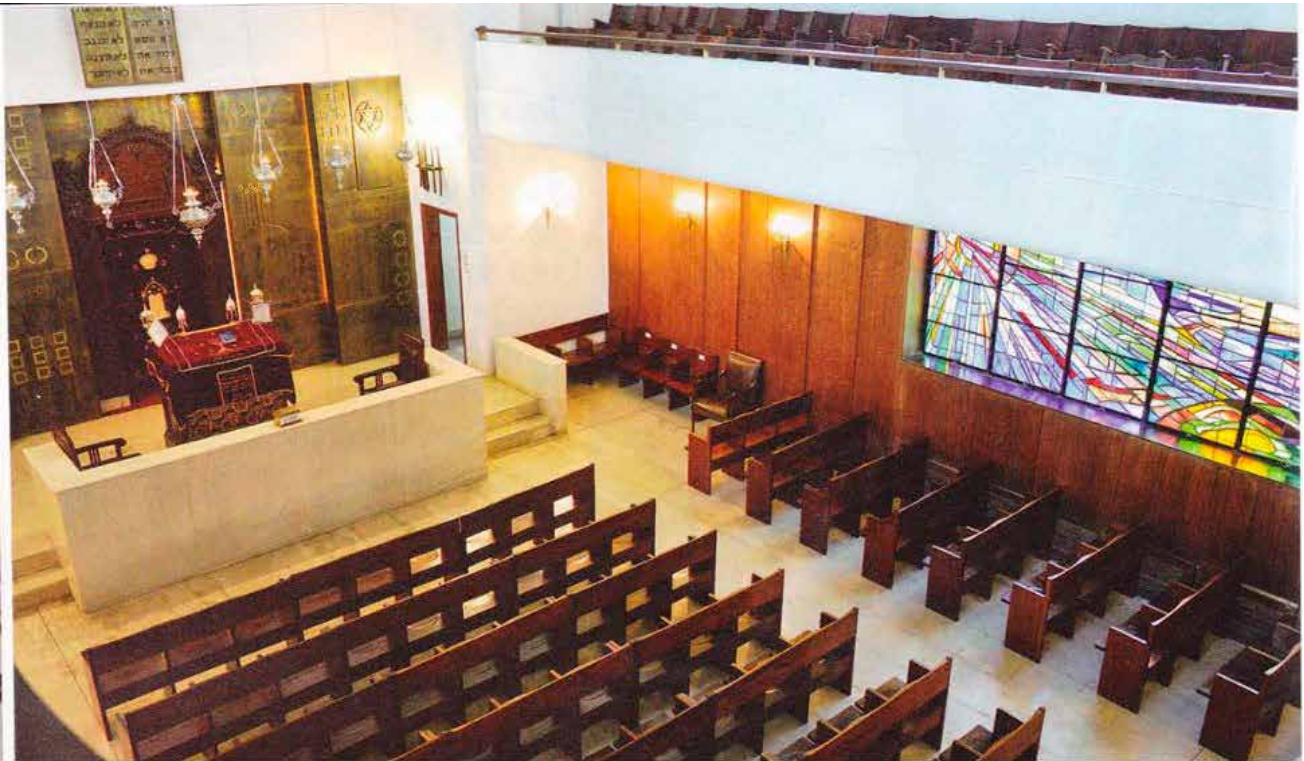
Άποψη από το εσωτερικό της Συναγωγής στην οδό Μελιδώνη, κτίριο του 1935