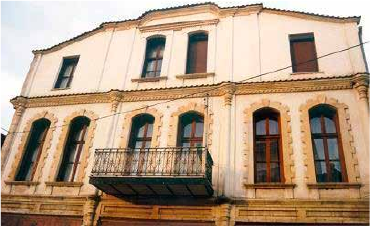
Οικία και κουκούλσπιτο Ελιέζερ Τζιβρέ στο Διδυμότειχο

γερμανοί κατάσχεσαν και ιδιοποιήθηκαν τις πρώτες ύλες και τα προϊόντα μεταξιού που βρήκαν στο εργοστάσιο 18 .