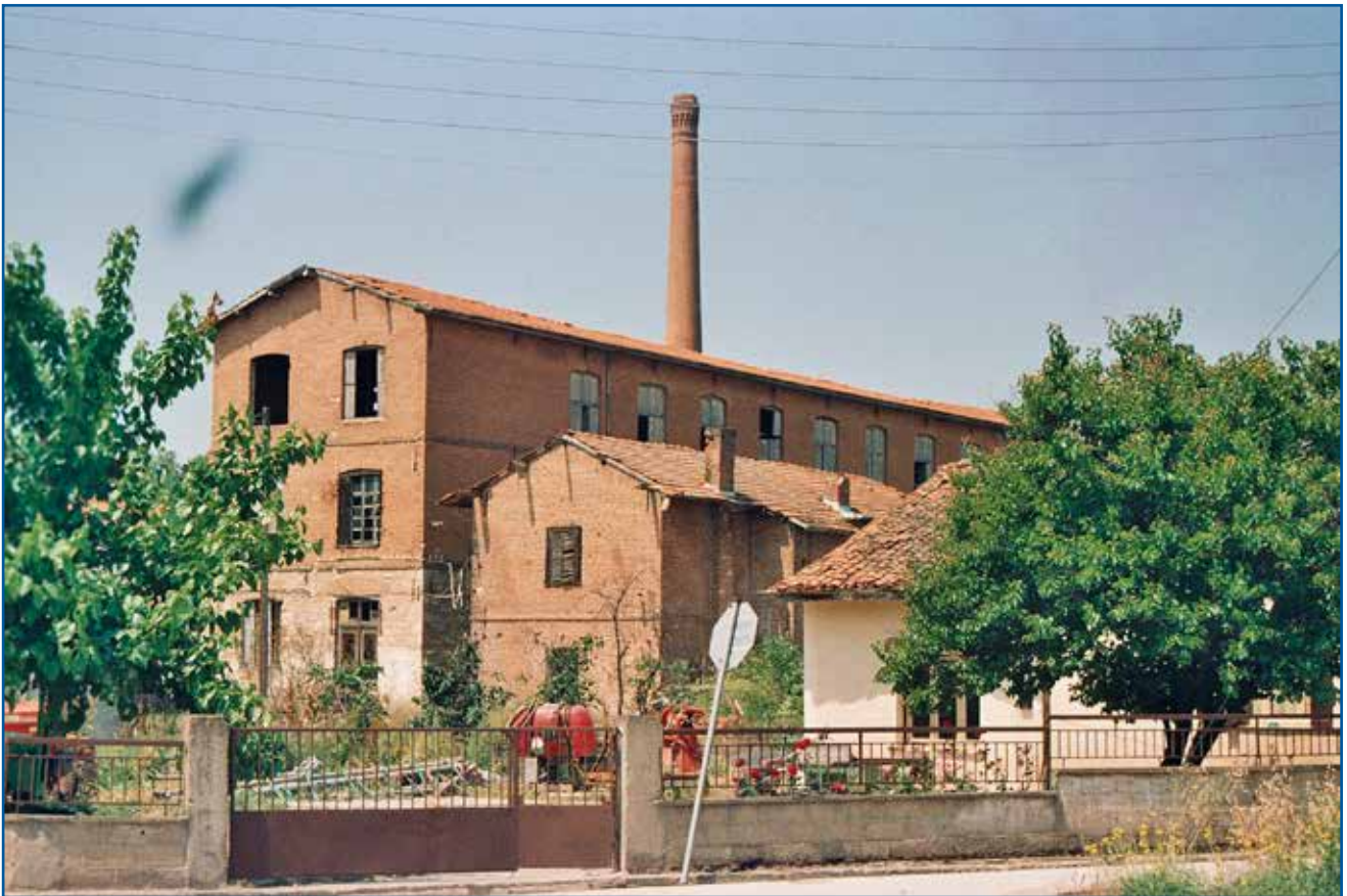
Μεταουργείο Τζιβρέ στο Σουφλί