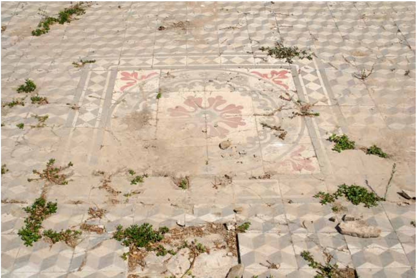
Το δάπεδο της Συναγωγής Διδυμοτείχου

ναγωγής και κοιμητηρίου και πιθανότατα τα χρόνια εκείνα και ενός εβραϊκού σχολείου. Όλα αυτά δεν υπήρχαν στο Σουφλί. Ο εβραϊκός του πληθυσμός – η Ισραηλιτική Κοινότητα με την ουσιαστική, την ανθρώπινη υπόσταση - ήταν μερικές δεκάδες άτομα. Στις διαθέσιμες στατιστικές φαίνεται ότι στα 1904 κατοικούσαν στο Σουφλί 25 Εβραίοι, στα 1928 ήταν 37 41 , ενώ λίγο πριν το Διωγμό, στα 1940, ο αριθμός τους είχε ανέλθει σε 40 42 . Άλλη στατιστική του 1906, του Bulletin d' Orient , αναφέρει 20 Ιουδαίους στον Καζά Σουφλίου, ανάμεσα σε 17.880 Έλληνες, 32.140 Τούρκους, 5.380 Βούλγαρους και 30 Αρμένιους 43 .