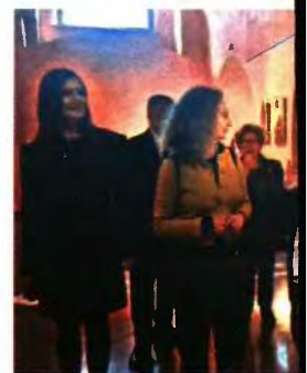
Σεμνήση στην έκθεση

Οι ξεναγήσεις που ολοκλήρωσαν τις εκδηλώσεις έφεραν τον κόσμο σε τοπόσημα που σηματοδοτούν τη μακρά πολυπολιτισμική ιστορία των Ιωαννίνων και την παρουσία της εβραϊκής κοινότητας, αλλά και ένα παρόν που με τον δικό του τρόπο φωνάζει ένα «ποτέ ξανά». Στη Συναγωγή που άνοιξε για την ημέρα, μερικά μέτρα μακριά από τον τόπο των εκδηλώσεων στο Κάστρο, τα εκατοντάδες ονόματα στους τοίχους όσων εξοντώθηκαν θυμίζουν ότι οι ζωές των ανθρώπων έχουν πάντα το δικό τους αποτύπωμα. Και η μνήμη στις μέρες μας δεν είναι μόνο η ιστορική τεκμηρίωση, αλλά και η συμπερίληψη της ίδιας της ζωής, των ανθρώπων, ως έκφραση της ίδιας της Ιστορίας.