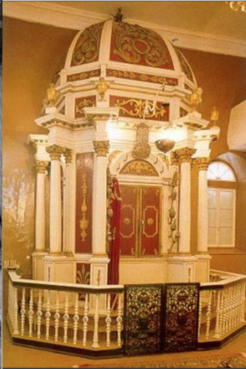
Το Εχάλ (Ιερό) της Συναγωγής "Σκουόλα Γκρέκα" στην Κέρκυρα