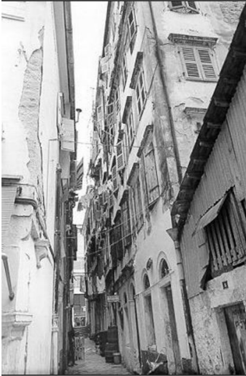
Αποψη της εβραϊκής συνοικίας στην Κέρκυρα