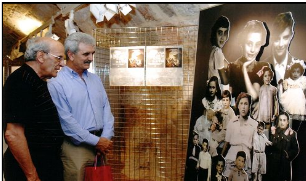
Ο Πρόεδρος του Κ.Ι.Σ. και ο Νομάρχης Δωδεκανήσου στα εγκαίνια της έκθεσης του Ε.Μ.Ε.