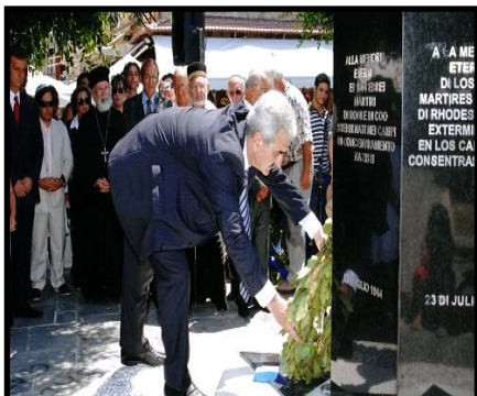
Στιγμιότυπο από την κατάθεση στεφάνων