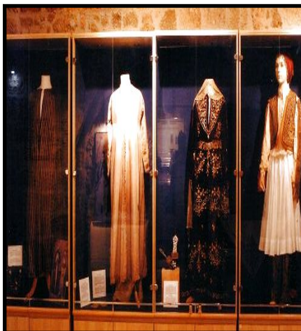
Άποψη του εσωτερικού του Μουσείου