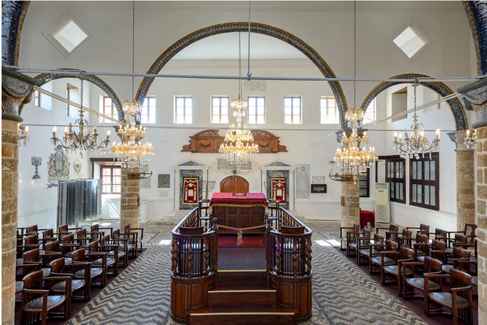
Τον 16ο αιώνα μ.Χ. πολλοί Εβραίοι

Οι Εβραίοι της Ρόδου επίσης καταγράφονται ως ένθερμοι υπερασπιστές της πόλης εναντίον των Τούρκων, το 1480. Μετά την επίθεση των Τούρκων στο νησί έμειναν μόνο 22 εβραϊκές οικογένειες, οι οποίες παρά τον φόβο των αρχικών επιθέσεων από τους Τούρκους ξαναβρήκαν τη δύναμη να συνεχίσουν τη ζωή τους.