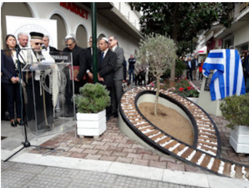
ΚΑΤΟΧΗ - ΔΙΩΓΜΟΣ

Οι Εβραίοι των Τρικάλων ασχολούνταν από το 16ο αιώνα και ύστερα με την παραγωγή μάλλινων, βαμβακερών, μεταξωτών και λινών υφασμάτων. Για καιρό διατήρησαν το "μονοπώλιο" του κρασιού ενώ τα μεταγενέστερα χρόνια ως τα πρόσφατα ασχολήθηκαν με το εμπόριο, τη βιοτεχνία και με διάφορα άλλα επαγγέλματα. Μερικοί από αυτούς αναδείχθηκαν στον επαγγελματικό στίβο διακρίθηκαν ως μεγαλέμποροι, τραπεζίτες, αργυραμοιβοί. Ήταν ευσεβείς και τηρούσαν την αργία του Σαββάτου. Η φιλανθρωπία τους δεν περιοριζόταν μόνο στο χώρο της Εβραϊκής Κοινότητας αλλά και στον ευρύτερο της πόλης, ενισχύοντας με δωρεές τους την ίδρυση Νοσοκομείου, Γυμναστηρίου και την προικοδότηση απόρων κοριτσιών. Θα πρέπει να αναφερθεί ακόμη, η συμμετοχή των Εβραίων στους εθνικούς αγώνες, στους δύο Παγκόσμιους Πολέμους, καθώς και στην Εθνική Αντίσταση, πληρώνοντας ανάλογο φόρο αίματος.