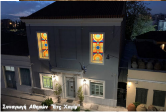
Συναγωγή Αθηνών Έως Χαγιάς