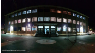
Λυκείο Ευαγγελικής Σχολής Αθηνών