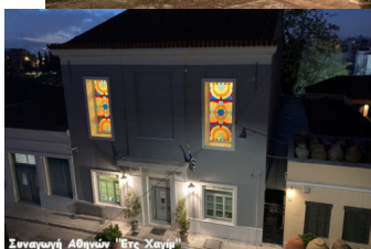
Συναγωγή Αθηνών Έως Χανίων