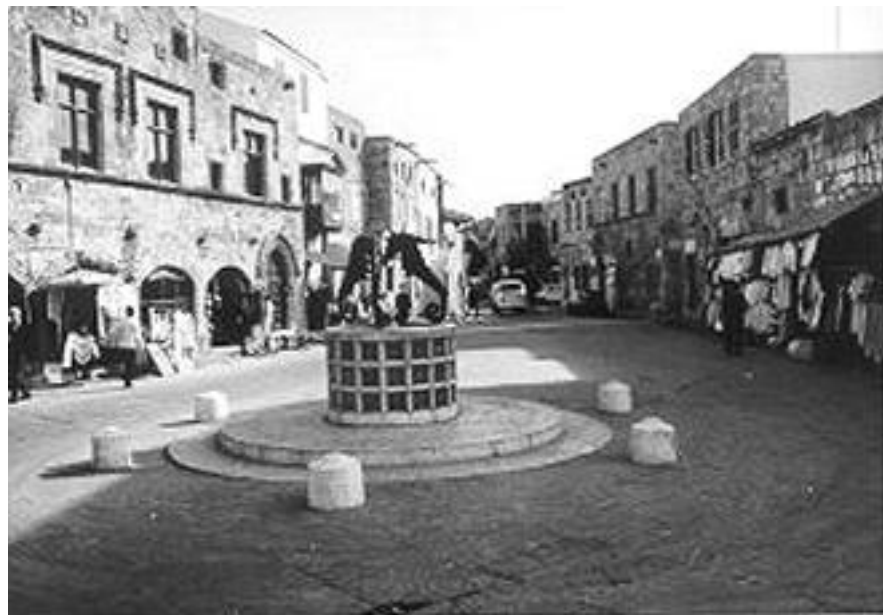
Άποψη της πλατείας Εβραίων Μαρτύρων στην Ρόδο