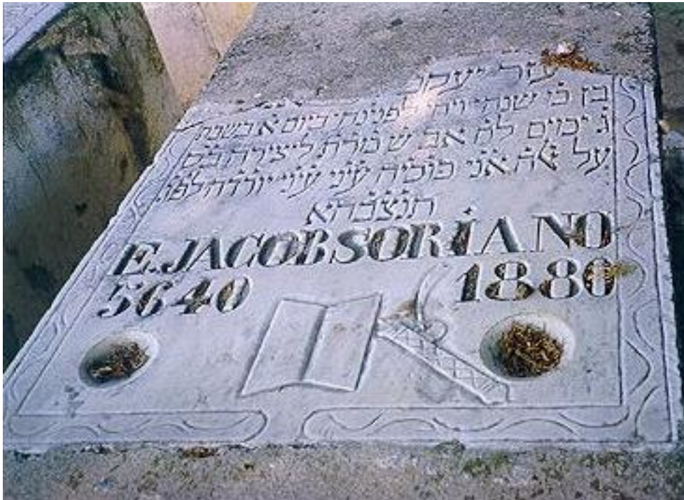
Άψος στο εβραϊκό Νεκροταφείο Ρόδου