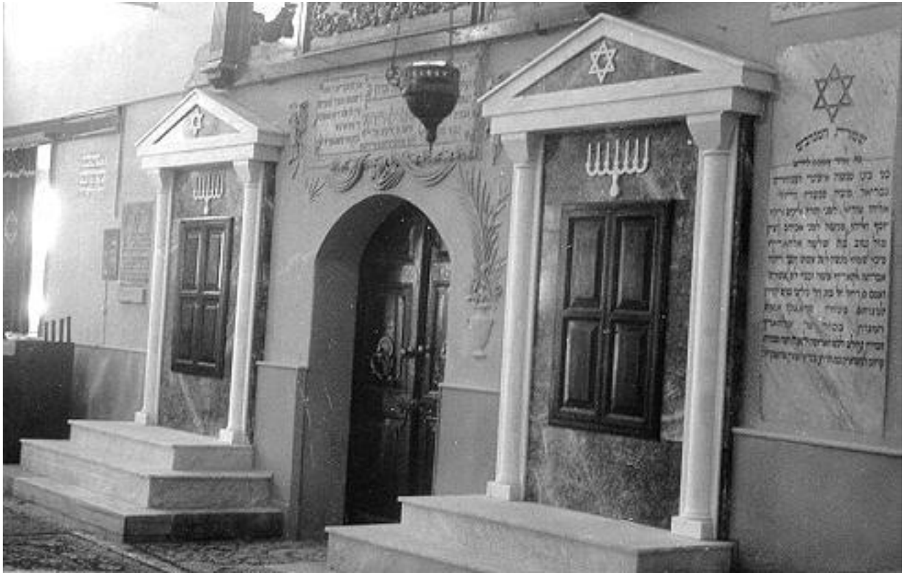
Εισαγωγικό της Συναγωγής Σαλώμ στην Ρόδο