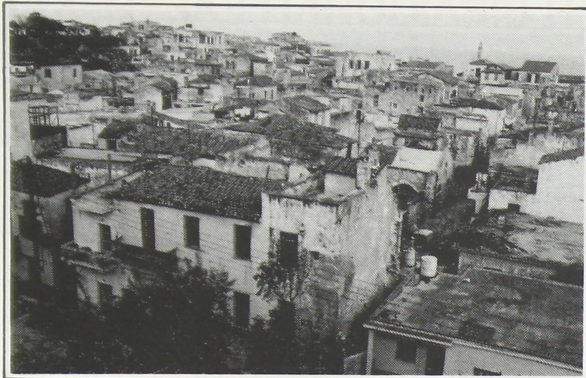
Γενική άποψη της άλλοτε Έβρικής συνοικίας στα Χανιά.

χειών, έπερνούσα από την Μεγάλη Όβραϊκή, ήσαν δέ όλοι πεινασμένοι Έβραίοι, οί όποίοι έδέχθησαν νά γίνουν χαμάληδες δια νά σηκώσωμεν τά βιβλία του Βενιζέλου. Τούς συνέστησα νά προσέχουν, τούς έμπασα εις τό σπίτι έφορτωθήκαμε 70 άθέωτα κασσόνια καί όσα λυτά βιβλία ηύραμεν. Έμπήκα εις τήν κρεββατοκάμαραν του Γερμανού στρατηγού, έπήρα όλα τά κλοπιμαία (όταν τό έμαθε άργότερα έγινε θηρίον!). Όλα αυτά έφορτώθησαν εις τά κάρρα των σκουπιδιών.