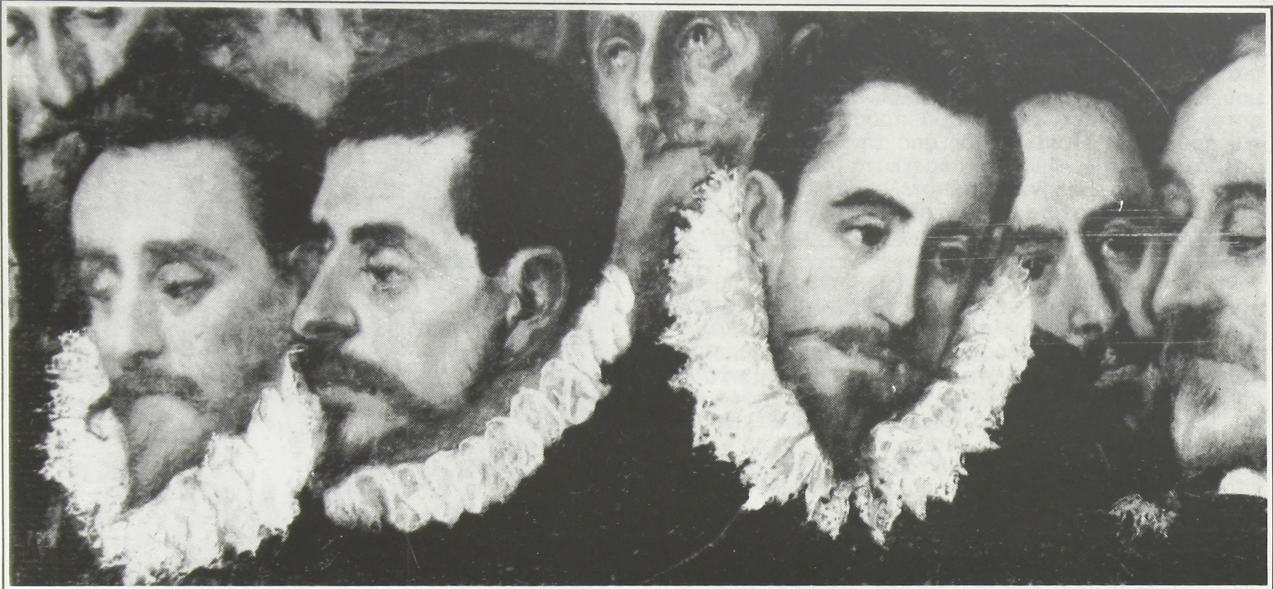
ΕΛ ΓΚΡΕΚΟ: ‘Απόσπασμα από την ταφή του Κόμητος ‘Οργκάθ

θώς τό προανάγγειλε στην «ΕΛΕΥΘΕΡΟΥΤΥΠΙΑ» ό φίλος μου ό Φρέντυ Γερμανός) άσχολούμαι, έντατικώς, μέ τό νέο μου βιβλίο «Πανόραμα Χειρονομιών στην ‘Ελλάδα». ‘Ετσι, ανατρέχοντας την βυζαντινή και νεοελληνική ζωγραφική, έφτασα κάποτε και στόν Γκρέκο. Καί, τότε (κατάπληκτος) είδα ότι, στό έργο του επανέρχονται έπιμωως δύο - τρεις στερεότυπες χειρονομίες. Μάλιστα, ή μανία του Γκρέκο είναι τόσο μεγάλη, ώστε καταντάει σκανδαλώδης . ‘Αρχισα νά άναρωτιέμαι: μά τί, διάολο, συμβαίνει; τί ήθελε νά πει ό Γκρέκο; άπό ποιό μυστικό άσφυκτιούσε; τί προσπαθούσε νά εκμυστηρευτεί;