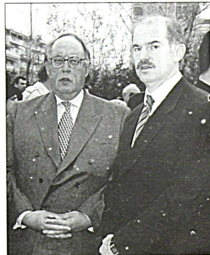
Ο υπουργός και ο ανα- πληρωτής υπουργός Εξω- τερικών κ.κ. Θεόδωρος Παγκαλός και Γεώργιος Παπανδρέου. Minister and Alternate Minister of Foreign Affairs Mr.Th. Pangalos and Mr. G. Papandreou.