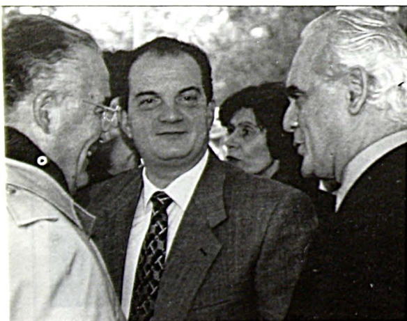
Ο Αμερικανός γερουσιαστής Πολ Σαρμπάνης, με τον αρχηγό της Αξιωματικής Αντιπολίτευσης κ. Κων. Καραμανλή και τον υπουργό Εθνικής Άμυνας κ. Α. Τσοχατζόπουλο. Senator Paul Sarbanes with the Head of the Opposition Mr Con. Karamanlis and the Defence Minister Mr. A. Tsohatzopoulos.