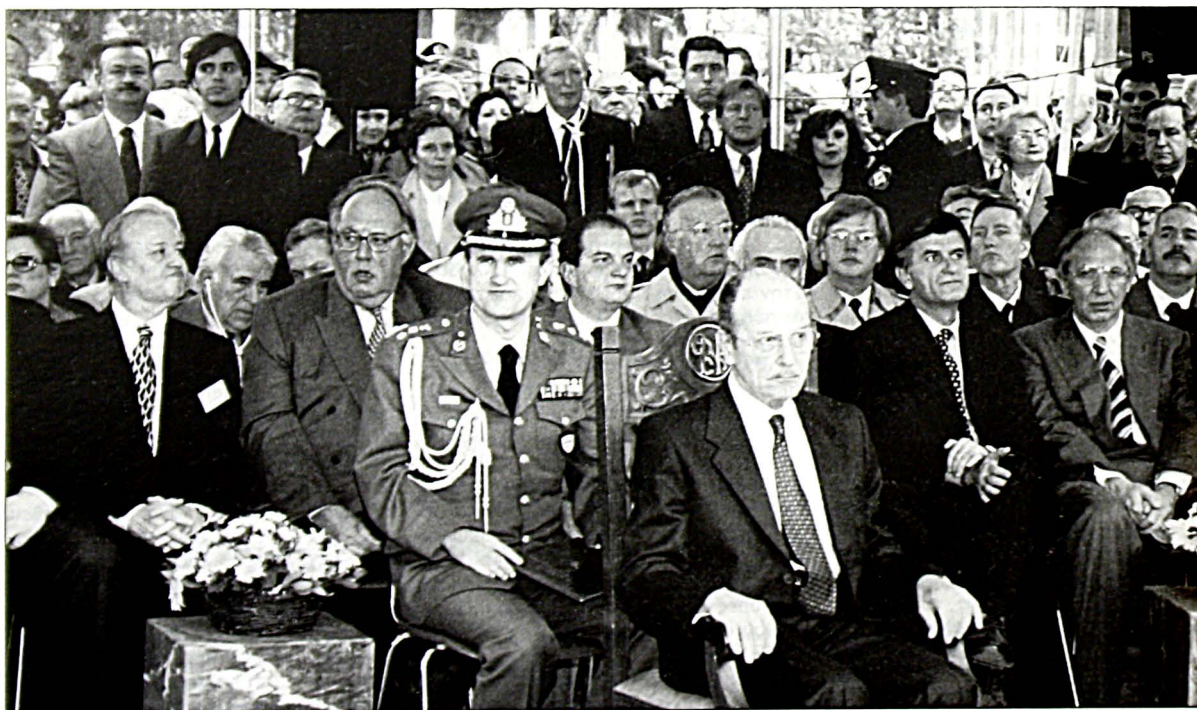
Οι επίσημοι στα αποκαλυπτήρια του Μνημείου. Μπροστά: ο Πρόεδρος της Δημοκρατίας κ. Κων. Στεφανόπουλος. Από αριστερά: ο υπουργός Πολιτισμού κ. Ευ. Βενιζέλος, ο πρόεδρος της Ι.Κ. Θεσσαλονίκης κ. Αν. Σεφτά, ο πρόεδρος της Επιτροπής Διεθνών Σχέσεων του Αμερικανικού Κογκρέσου κ. Μπεν Γκίλμαν, ο υπουργός Εξωτερικών κ. Θ. Πάγκαλος, ο αρχηγός της Αξιωματικής Αντιπολίτευσης κ. Κων. Καραμανλής, ο Αμερικανός γερουσιαστής Πολ Σαρμπάνης, ο υπουργός Εθνικής 'Αμυνας κ. Α. Τσοχατζόπουλος, ο υπουργός Μακεδονίας - Θράκης κ. Φ. Πετσάλνικος, ο πρέσβης της Γερμανίας κ. Φρ. Ράιτς, ο υπουργός Εργασίας κ. Μ. Παπαϊωάννου και ο πρέσβης του Ισραήλ στην Ελλάδα κ. Ρ. Κούριελ.

Τη Δευτέρα 24.11.97 ο Αμερικανός βουλευτής, καθώς και αντιπροσωπεία των εβραϊκών οργανισμών του Εξωτερικού, έφτασαν στην Αθήνα και συνοδευόμενοι από τον πρόεδρο του ΚΙΣ και τον πρόεδρο του Συμβουλίου Αποδήμου Ελληνισμού κ. Α. 'Αθνης συναντήθηκαν με τον πρωθυπουργό κ. Κων. Σημίτη.