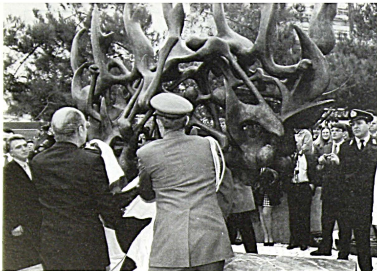
The President of the Hellenic Republic Mr Con. Stefanopoulos unveils the Holocaust Monument dedicated to the Jewish Victims of Thessaloniki