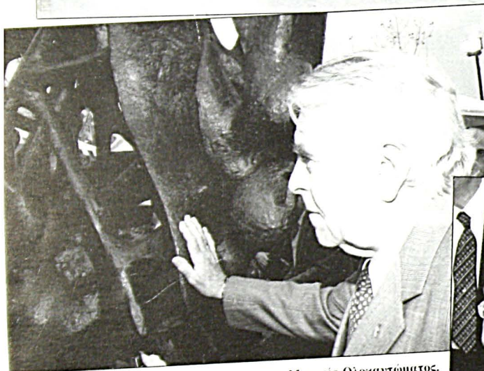
Ο Αμερικανός βουλευτής κ. Μπ. Γκίλμαν στο Μνημείο Ολοκαυτώματος. Congressman B. Gilman at the Holocaust Memorial.