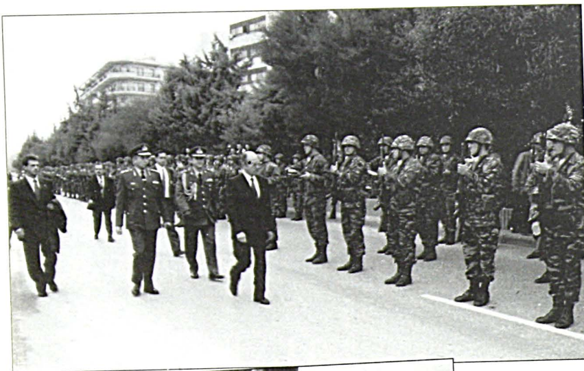
Άφιξη του Προέδρου της Δημοκρατίας στο χώρο του Μνημείου. Arrival of the President of the Republic at the Monument site